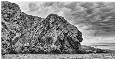
Testa de Moro

- Cap de Biara: el lloc és esmentat dins el capbreu d'Argelers, de 1292, sota les formes Biarra, Biarre, Biar. És un cap que és de mal descapelar amb totes les mars que sigui, mar de llevant, de tramuntana, de roenga, és de mal passar. El vent més difícil