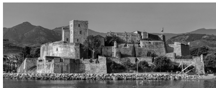
Castell Reial de Colliure

Era bo per al sard quan la mar picava amb llevant no massa fort, que la Llosa rompia, que l'aigua muntava sus la Passarella; aquí quan pescaven de canya amb moques sempre l'escada tirava cap a fora; en brumejant feien venir el peix, sard, llobarro, al mig de l'escuma. És un clot que quan hi ha mar fa un rec de corrent que s'emporta l'escada cap a fora. Quan és bonança i poca mar no s'hi pot pas pescar perquè l'escada se'n va a fons i hom enroca.