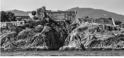
Caranca del Mirador