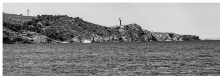
Cap de Biarre