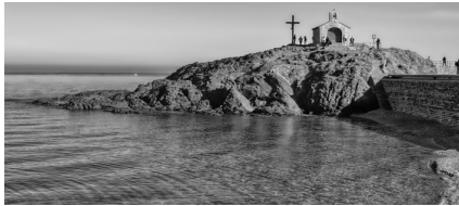
Illà de Sant Vicenç

- Caranca del Mirador: és una esquadra oberta dins el penya-segat de la costa al cim del qual se troba el Mirador, antic nom de la Miranda, lloc estratègic des del qual al segle XIX i potser abans un pescador vigilava l'arribada de les mates de tonyines.