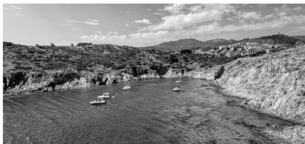
Badia de la Moresca