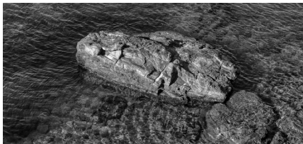
Taule dels Capellans

- Platja de l'Alga, dels Botons, dels Moltons: platgeta desapareixida sota el formigó quan