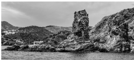
Castell del Valló

- Acaneig d'en Draper: un cerverenc, en Draper, venia sempre a pescar de canya en aqueix rodal; deixava el canot de terra a l'abric de Canadells. Un cop li va venir una mata d'orades,